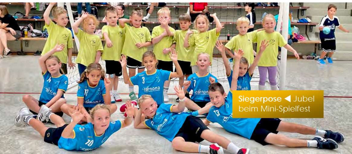
Siegerpose ◀ Jubel beim Mini-Spielfest

Unser Dank gilt allen, die sich in und für die Abteilung engagieren und denjenigen, die unsere Arbeit, egal in welcher Form, unterstützen. Ein besonderer Dank geht an die Gemeinde für die – kostenlose – Bereitstellung der Sportstätten und die finanzielle Unterstützung im Bereich der Übungsleitungen – was in der heutigen Zeit nicht mehr selbstverständlich ist.