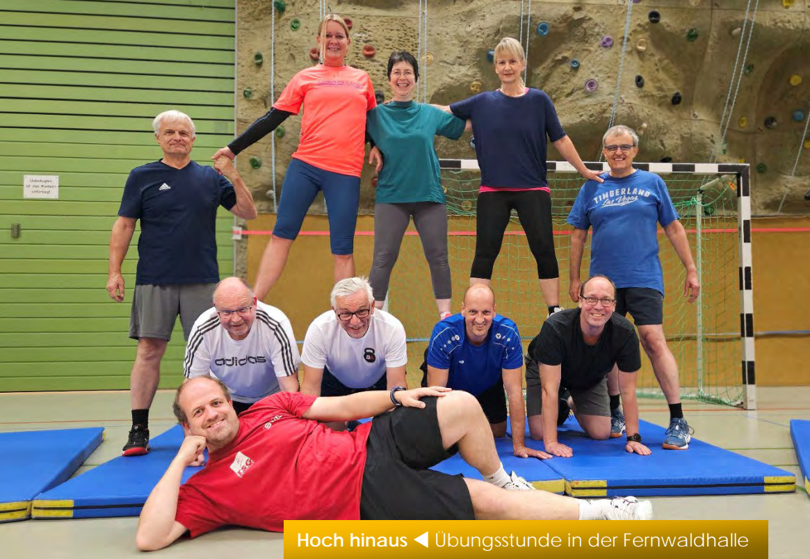
Hoch hinaus ◀ Übungsstunde in der Fernwaldhalle