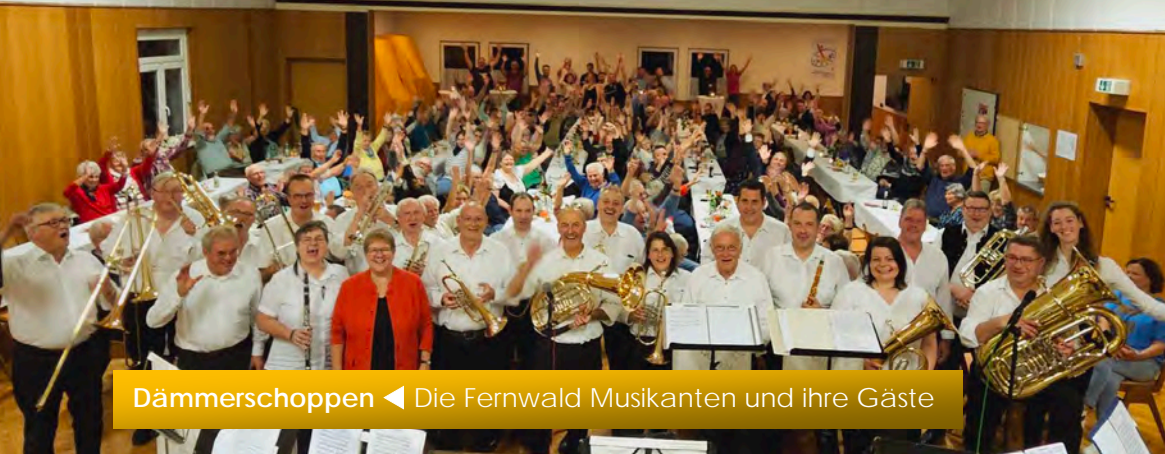
Dämmerchoppen ◀ Die Fernwald Musikanten und ihre Gäste