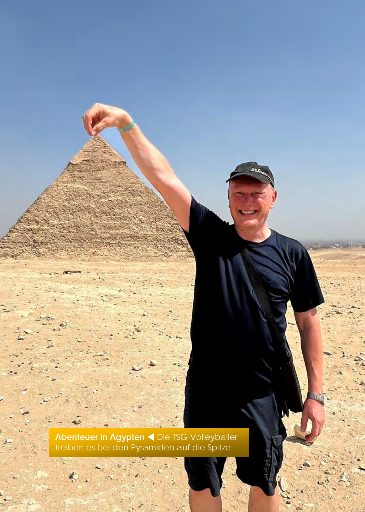
Abenteuer in Ägypten ◀ Die TSG-Volleyballer treiben es bei den Pyramiden auf die Spitze