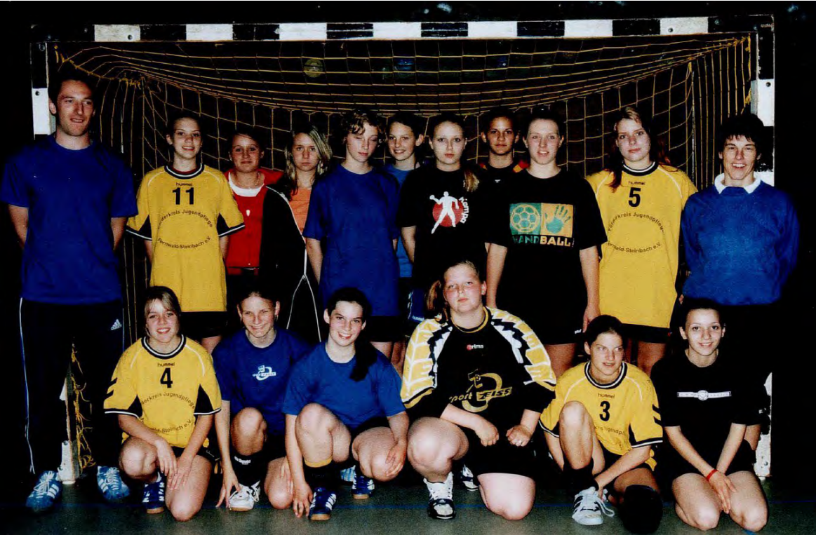
20 Jahre HSG Fernwald Teil 1 ◀ Oben präsentiert sich die weibliche C-Jugend mit ihrem Betreuersteam im Gründungsjahr 2004. Unten wird das gemeinsame Logo vorgestellt, das in den letzten zwei Dekaden viele Shirts und Pullover in Steinbach und Annerod zieren durfte.